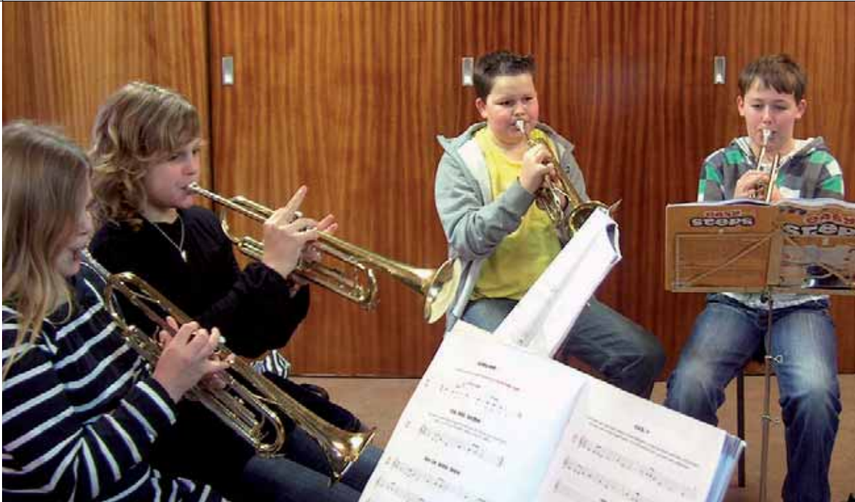
Onder schooltijd krijgen de kinderen les van een professionele trompetleraar.