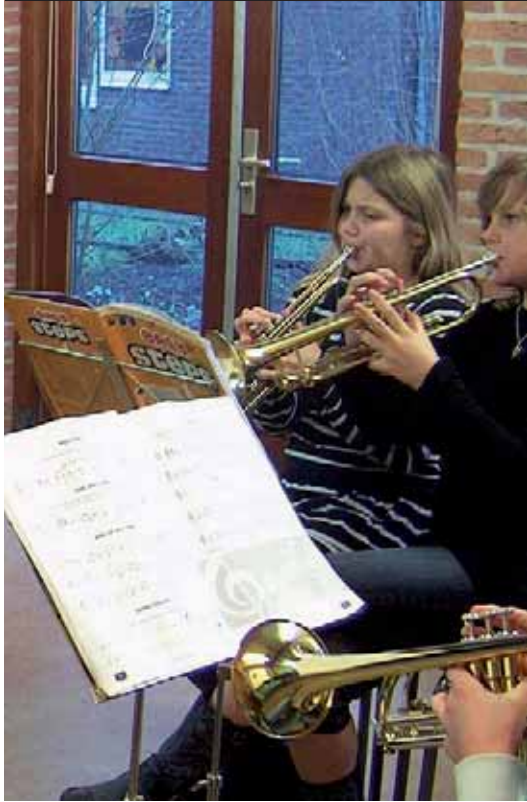
In het dorps- huis blazen de kinderen er lustig op los.

doen. Het moet niet. En het is al helemaal geen verplicht huiswerk. Dat is het hele verhaal.'